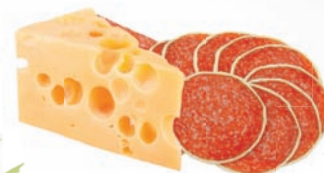
11256 Salámová pizza 175 g