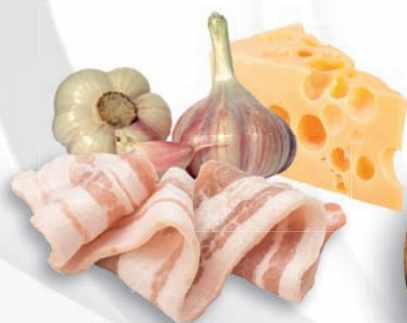
11252 Smotanový osůch 220g, 20 ks