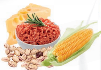
11258 Mexická pizza 175 g