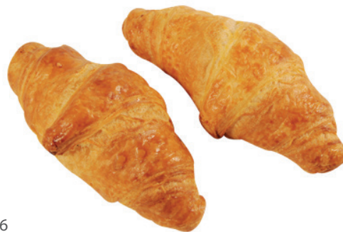
La Lorraine Maslový croissant