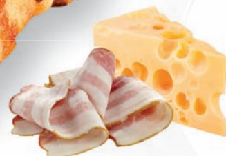
11253 Bacon slatinová pizza 175 g