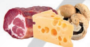
11254 Šunkovohříbová pizza 175 g