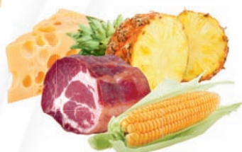
11257 Hawai Pizza 175 g